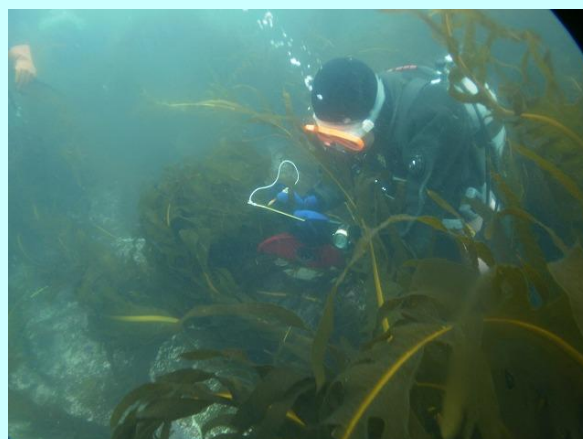
磯根資源の潜水調査