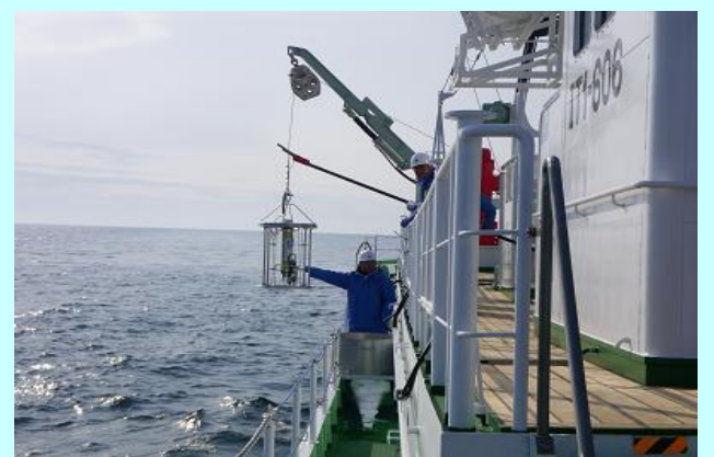
指導調査船の海洋観測