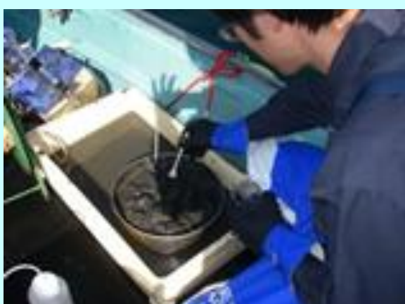
養殖漁場の底質調査