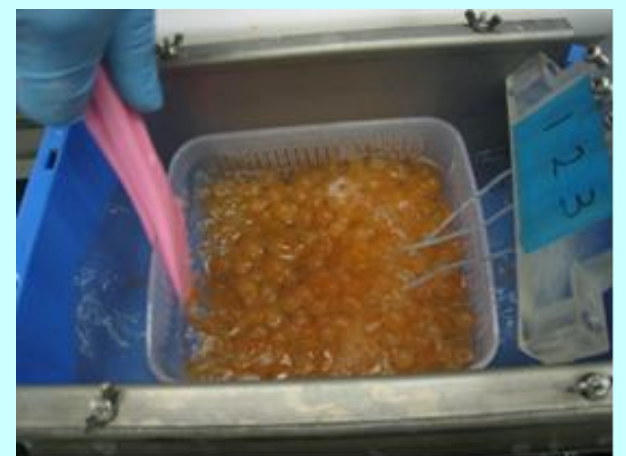
イクラの通電加熱試験