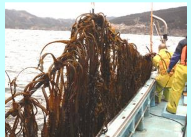
ワカメ人工種苗の養殖試験