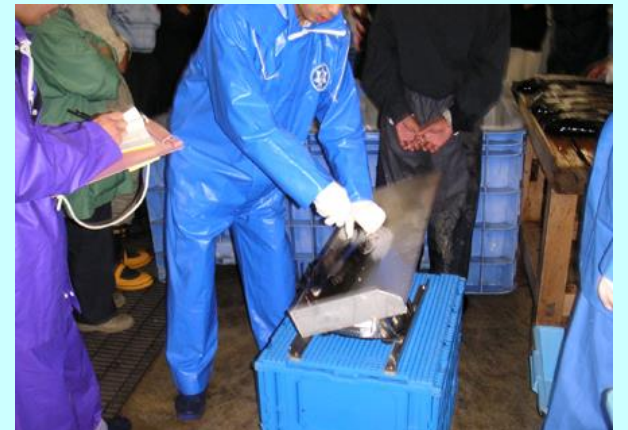
秋サケ回帰親魚の現地調査