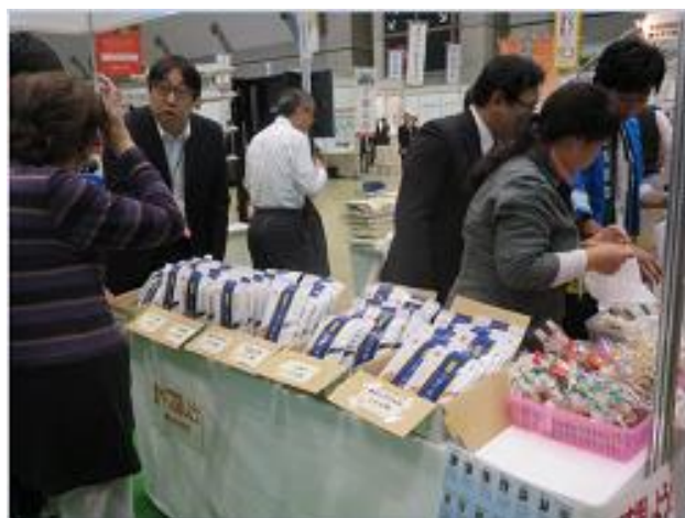
共同研究企業の成果品販売