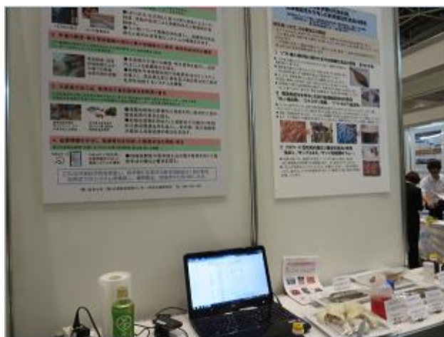
岩手県水産技術センターの展示ブース