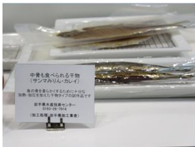
ソフト感を重視した高付加価値型食品