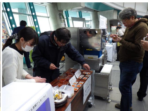
通電加熱イクラの試食