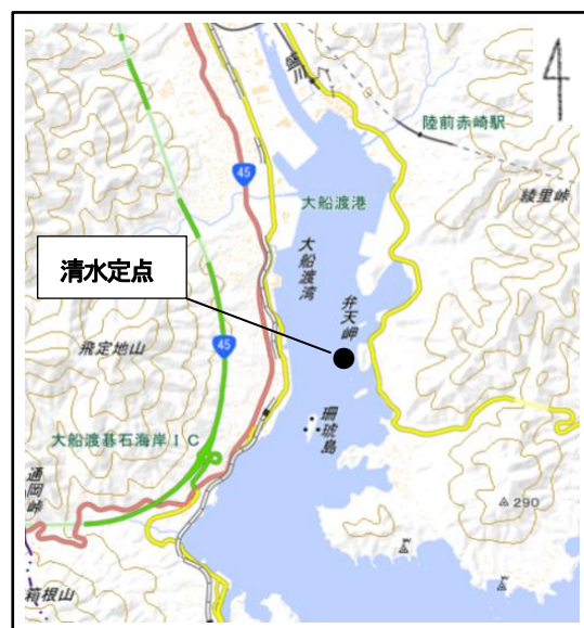
図1 大船渡湾清水定点(●) (国土地理院の電子地形図に調査定点を追加して掲載)

マガキの毒性が最高値37.9MU/gとなった5/16からの推移を表1に示す。毒性は減衰途中で多少の増減はあったものの速やかに減少し、約1ヶ月半後の6/27以降は安定して規制値の4MU/gを下回った。