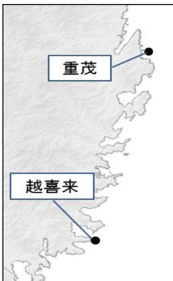
表2: 湾外の定地水温(3月12日・7時)