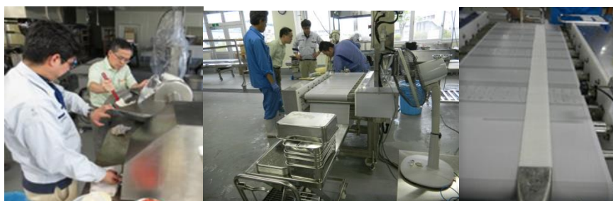
図 1 イカソフト化食品の製造の様子 (左からすり身調製, 通電加熱装置, 連続成形)

イカ 3 種 (アメリカオオアカイカ、紫イカ、スルメイカ) の外套膜の原料 (ベタ) に、3%の食塩を加えて塩播したすり身を、モノーポンプにより幅 5 cm×高さ 5 mmの配管出口へ連続的に押出成型しながら、ベルトコンベア式通電加熱装置で加熱して試作品を得た (図 1)。試作品は直径 5 mmの球形プランジャーを用いて、突き刺した時の破断強度を測定した。