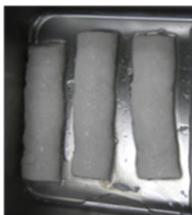
図 2 通電加熱後の試作品 (アメリカオオアカイカ)

イカ 3 種 (アメリカオオアカイカ、紫イカ、スルメイカ) について、それぞれ水分量を 85%程度に調製して得た試作品の破断強度を比較すると、紫イカ、スルメイカに比べてアメリカオオアカイカが 0.7N と最も柔らかかった。さらに 88.2%まで加水して調製した試作品では 0.6N まで破断強度が低下した。試作品からの離水も起こっておらず、咽喉越しのよいソフンペンに類似した柔らかい食感を有する試作品ができた (図 2, 3)。