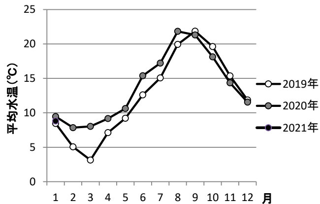
図1 山田湾定点における平均水温(5・10・15m)の推移