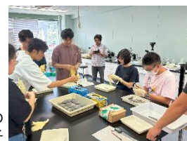
大学院生の 実習の様子