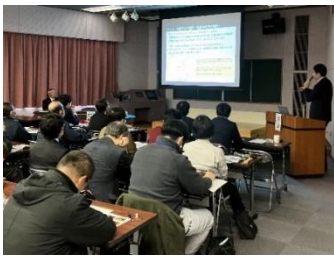
漁業関係者等を対象に開催した水産試験研究成果等報告会の様子