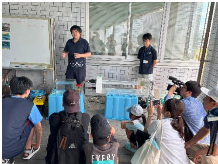
一般公開デー 特別公開「サケ稚魚の遊泳力の測定」