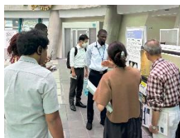
海外研究者の視察研修の様子